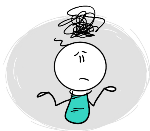
PROBLEMY Z KONCENTRACJĄ