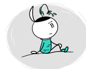
TRUDNOŚCI W KADZENIU SOBIE Z NUDĄ