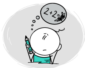
TRUDNOŚCI Z NAUKĄ