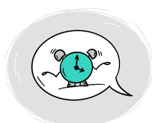
MOŻLIWE OPÓŹNIENIE MOWY