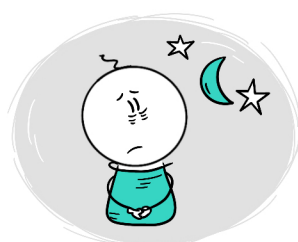
TRUDNOŚCI Z ZASYPIANIEM