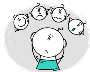
NIERADZENIE SOBIE Z EMOCJAMI